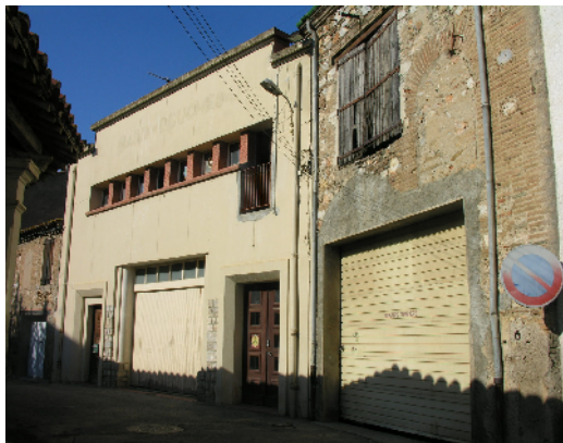
La caserne des pompiers est fermée.