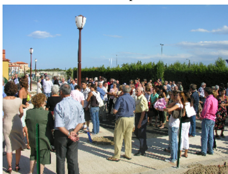
Inauguration de la place Yvon Gourbal