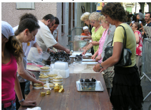
«moules-frites» pour la fête locale