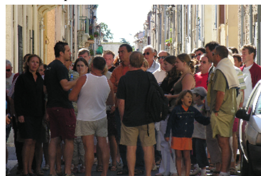
Visite guidée du village