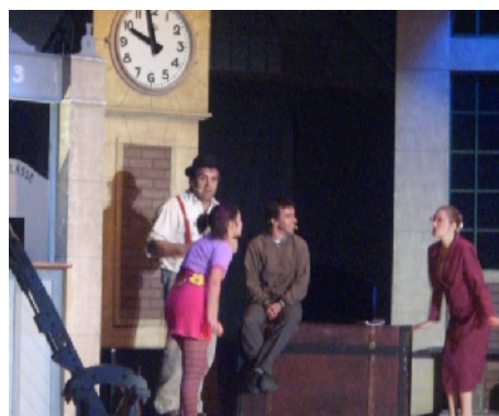
Hommage à Charles Trénet