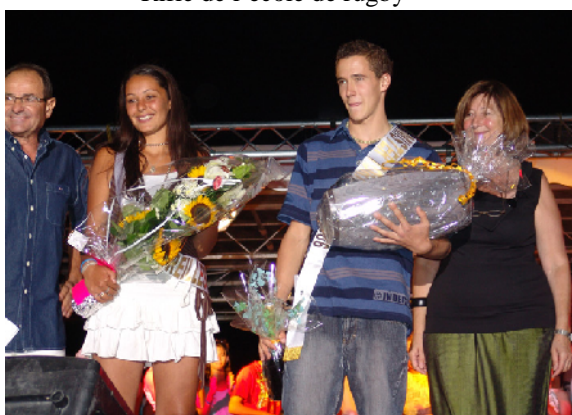
Election de Mister et Miss Torreilles