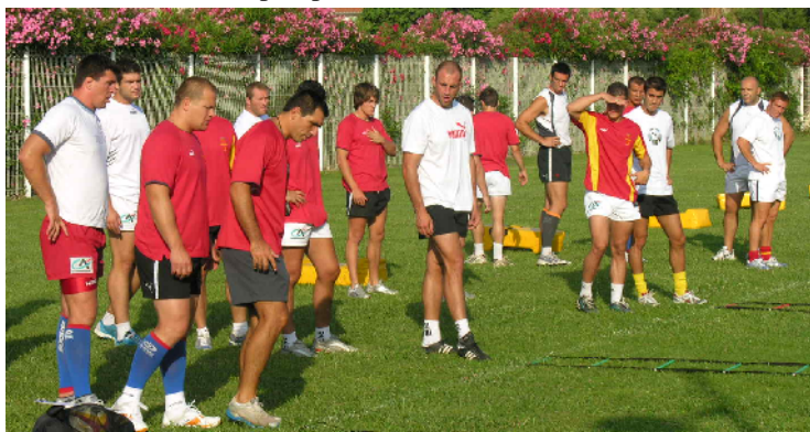
L'U.S.A.P. à Torreilles