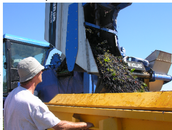
La machine à vendanger a remplacé les traditionnels «coupeurs»