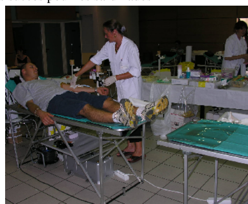
45 flacons de sang recueillis