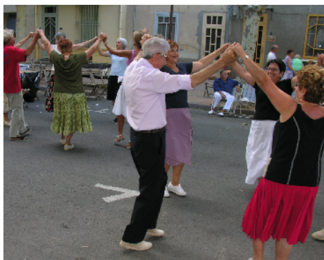
Les rondes de sardane