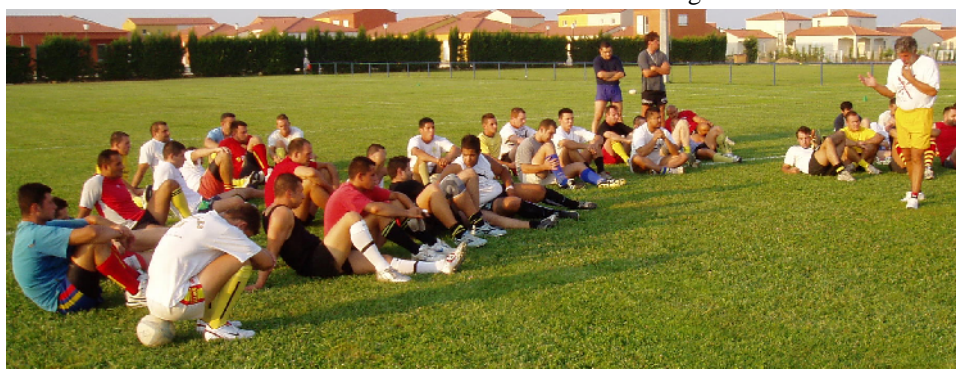
L'U.S.T. retrouve sa pelouse