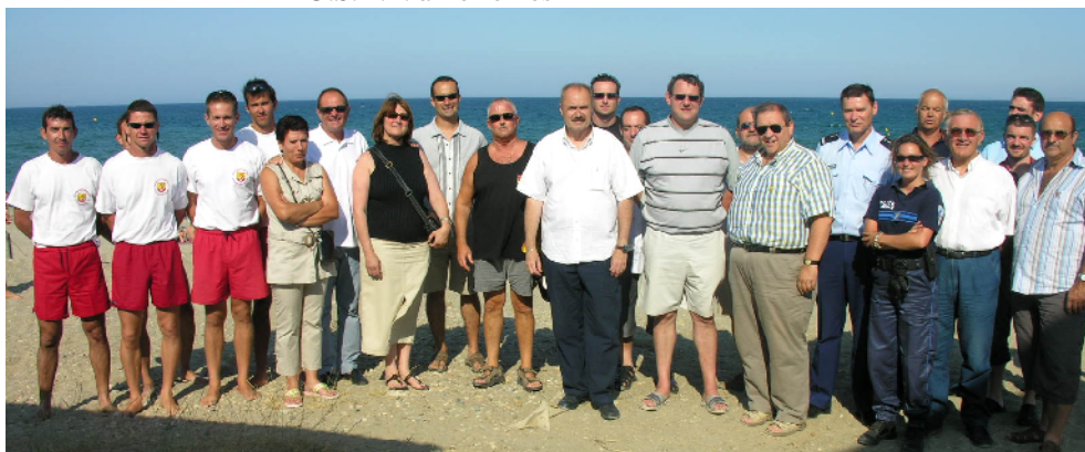
Visite de la station