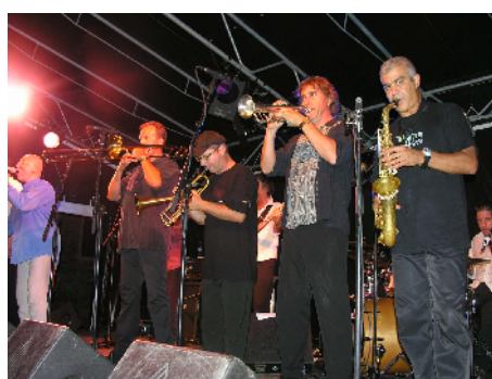
Jazz à Juhègues