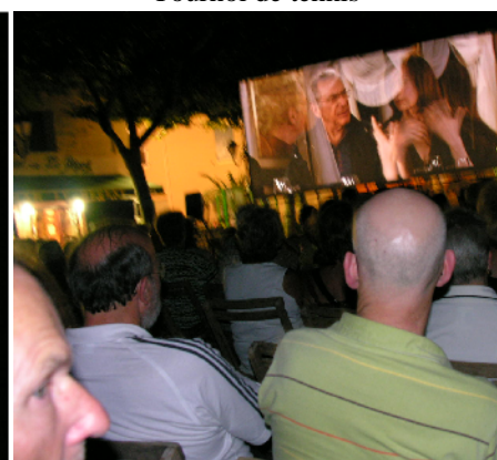
Cinéma en plein air