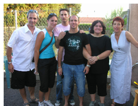
Tournoi de tennis