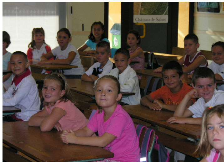
Les enfants de l'école primaire sont déjà prêts à travailler.

La saison estivale, qui s'achève, déjà, sans être une grande cuvée, rentrera dans la catégorie des saisons normales. Vous trouverez dans les pages intérieures, une rétrospective-photos des moments forts de l'été 2006.