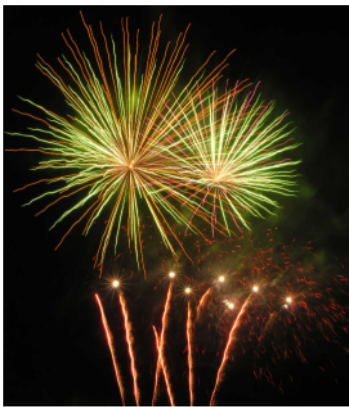
Le feu d'artifice illumine le ciel