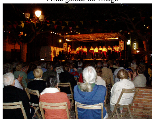
Les cantayres catalans : un régal