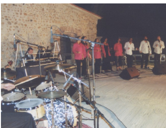
Estiu musical : gospel à Juhègues