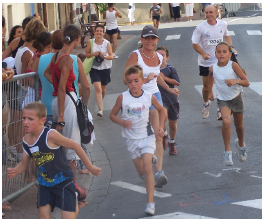
Cyclathlon pour les sportifs