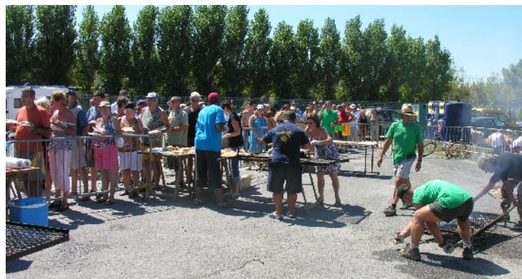
Gros succès pour les sardinades