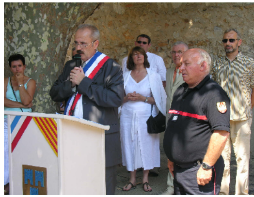
Discours du 14 juillet