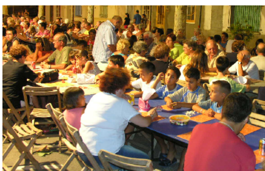
Rifle de l'école de rugby