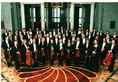
Sinfonia Varsovia au festival de Torroella