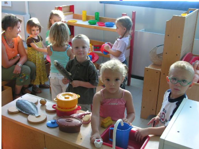
Les enfants de l'école maternelle ont retrouvé leurs jeux